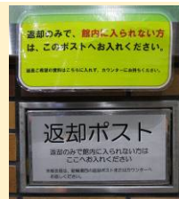
正面玄関の返却ポスト