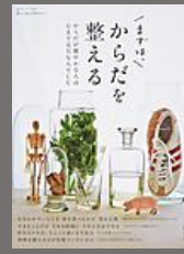
まずは、からだを整える 主婦と生活社