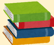
延長する本 返す本