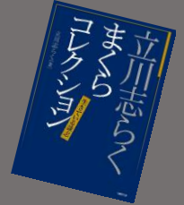
立川志らくまくらコレクション 立川志らく/著 竹書房