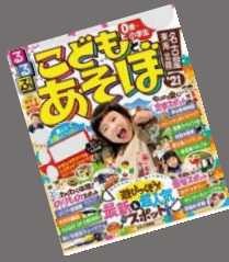
るるぶこどもとあそぼ！ 名古屋東北陸 '21 JTB パブリッシング