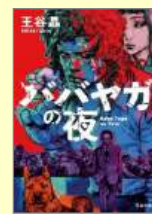
「ハバヤガの夜」 王谷晶/著 河出書房

にしお電子図書館 HP https://web.d-library.jp/nishio/