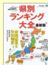
「県別ランキング大全」 矢野新一/著 柊出版社