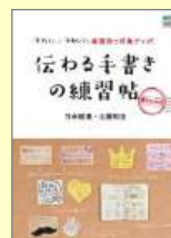
「伝わる手書きの練習帖」 竹永絵里/著 柊出版社