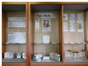
3階常設展示コーナー