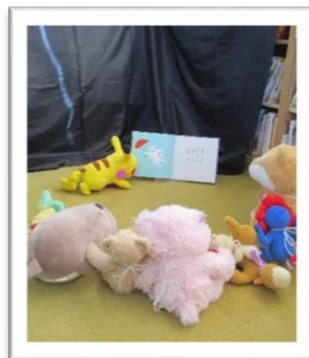
夜の図書館でぬいぐるみたちだけのおはなし会!?

吉良図書館では小学生以下対象のイベントも多数行っています。たとえば2月に開催した『ぬいぐるみおとまり会』。ぬいぐるみと一緒におはなし会に参加し、ぬいぐるみだけそのまま図書館にお泊りする企画で、たくさんの方から参加のご希望をいただきました。他にもおはなし会や工作会・クイズなど楽しいイベントをご用意しています。ぜひお子さん、お孫さんと一緒にいらしてください。