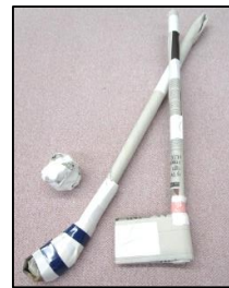
まどあ 的当てゲーム