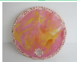
マーブリングうちわ

じ 時間： かん 午後2 じ 時～ かん 午後3 じ 時30 ぶん 分 たい 対象： しょうがく 小学4～6年生 てい 定員： いん 10 にん 人（ せんちやくじゆん 先着順） もち 持ち物： もの 筆記用具