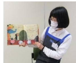
えほん の読み聞かせをします。