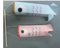
くわさく いちれい 工作の一例 →