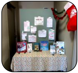
クリスマスのおはなし